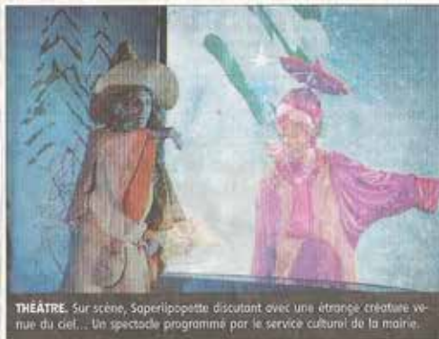
THÉÂTRE. Sur scène, Saperlipopette discutant avec une étrange créature venue du ciel... Un spectacle programmé par le service culturel de la mairie.

D es étoiles lumineuses dansent sur un rideau bleu. La nuit de Noël est tombée hier sur la scène du Centre culturel devant l'ensemble des maternelles des écoles de Langeac. La compagnie « LÉZ'arts vivants » venue de Vertaizon, proposait à son très jeune public « Le Noël de Saperlipopette », un magicien « super chouette » amateur de