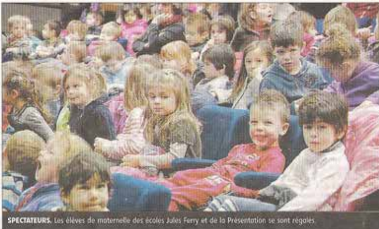
SPECTATEURS. Les élèves de maternelle des écoles Jules Ferry et de la Présentation se sont régalés.

rimes et vêtu par les bons soins du Père Noël en personne. Puis un écran s'illumine, dans le fond, engendrant un second décor et son propre univers. La compagnie auvergnate aime mêler dans ses spectacles théâtre, images filmées et chansons. Les comédiens passent ainsi d'une dimension à l'autre, suscitant chez les enfants (mais ceci fonctionne également